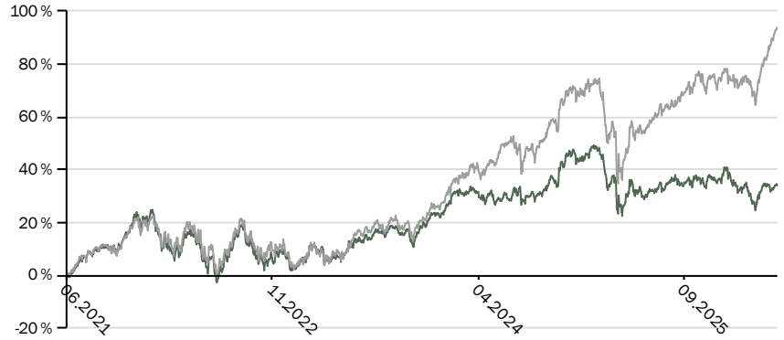
Odin USA A EUR (dark green), Indeksi (grey)